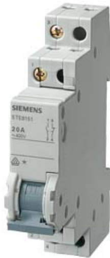
WECHSELSCHALTER 20A 1S 10E