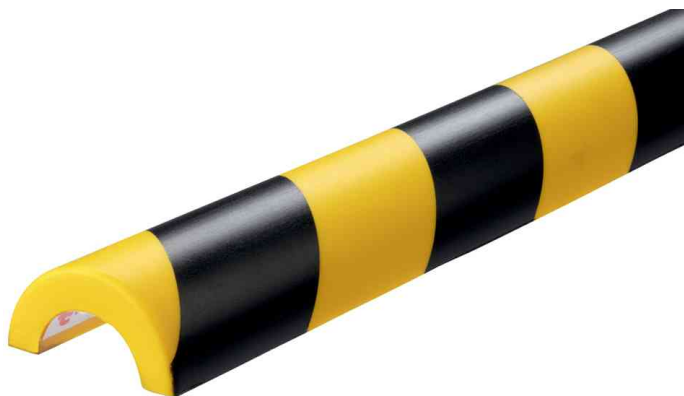
Profilé de protection pour tubes P30