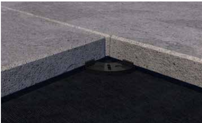
Das Plattenlager kann einzeln unter Steinplatten verwendet werden ...