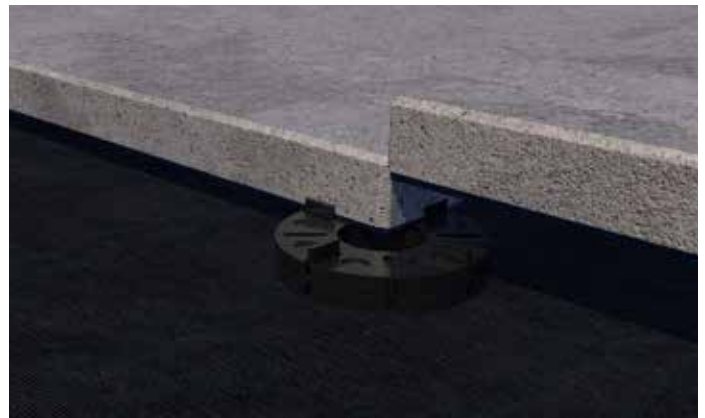
... oder doppelt.