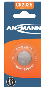
Lithium Knopfzelle, CR2025