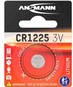
Lithium Knopfzelle, CR1225