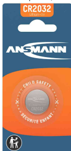
Lithium Knopfzelle, CR2032