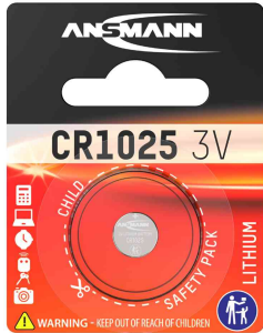
Lithium Knopfzelle, CR1025