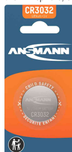
Lithium Knopfzelle, CR3032