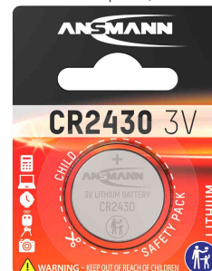
Lithium Knopfzelle, CR2430