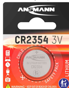
Lithium Knopfzelle, CR2354