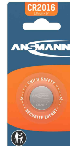
Lithium Knopfzelle, CR2016