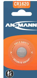
Lithium Knopfzelle, CR1620