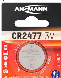
Lithium Knopfzelle, CR2477