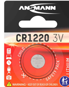
Lithium Knopfzelle, CR1220