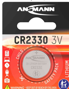
Lithium Knopfzelle, CR2330