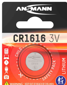
Lithium Knopfzelle, CR1616