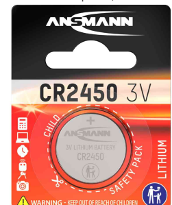
Lithium Knopfzelle, CR2450