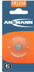
Lithium Knopfzelle, CR1216