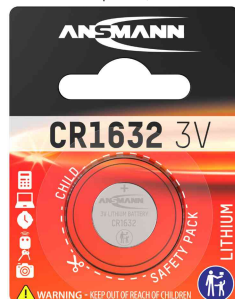
Lithium Knopfzelle, CR1632