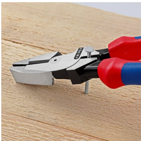
Zona de agarre por debajo de la articulación para apalancar con fuerza.

Reservado el derecho a realizar modificaciones técnicas. Salvo error u omisión.