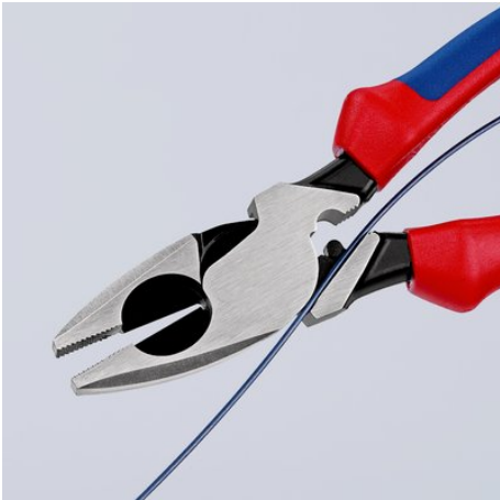
09 11/12 240: Dispositivo de ayuda para insertar cables en la ranura de la articulación.