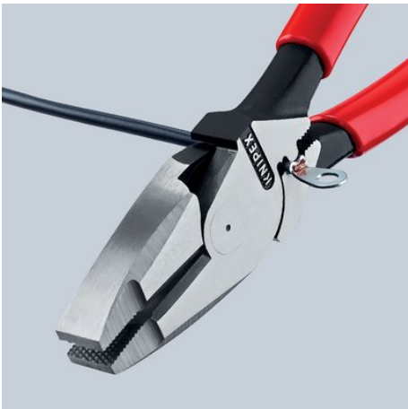
09 11/12 240: Dispositivo mandril universal de crimpado debajo de la articulación.