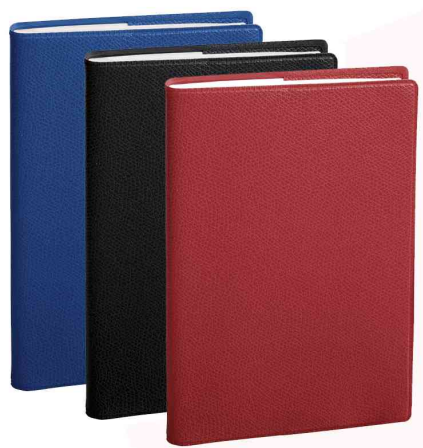
Agenda "Consul", assorti