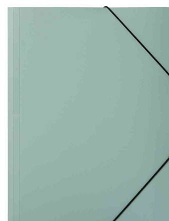
Chemise à élastiques "Pastell Eco", vert pastel