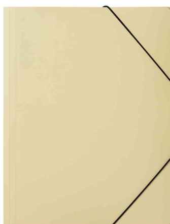
Chemise à élastiques "Pastell Eco", jaune pastel