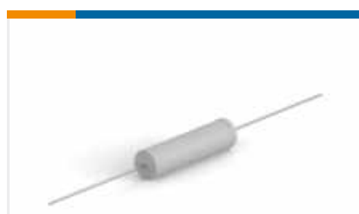
TE Teilnr.:4-2176414-8 7W STD M/OX 5% 1K8