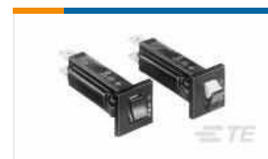
TE Teilnr.:1-1393250-7 W28-XQAT-15=W28