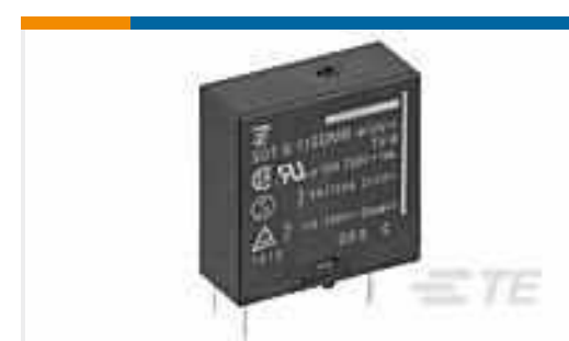
TE Teilnr.:8-1419125-5 SDT-S-106LMR,000