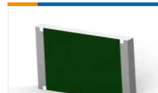
TE Teilnr.:8-2176407-8 3560 27R 5%