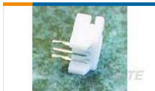
TE Teilnr.:1-440055-1 2.0MM,HDR,11POS,R/A