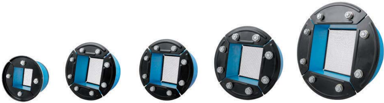
R 100 galv

R 型框架，镀锌挡板 | R-Rahmen, feuerverzinkte Beschläge | Marco R, componentes galvanizados | Bague R, acier galvanisé