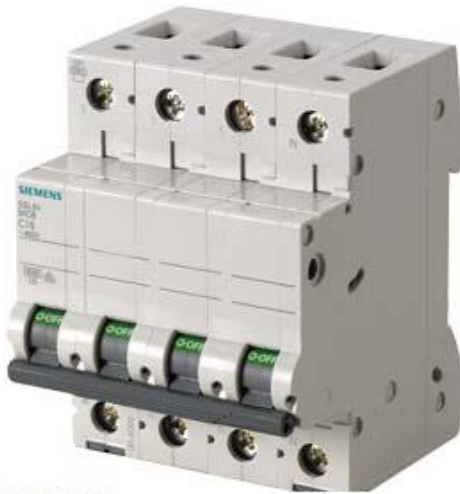
LEITUNGSSCHUTZSCHALTER 400V 6KA, 3+N-POLIG, B, 16A