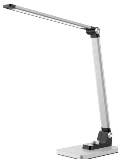
LED-Tischleuchte Breeze, silber-gebürstet