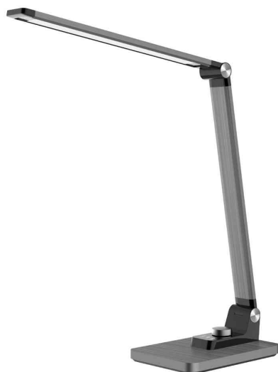
LED-Tischleuchte Breeze, grau-metallic