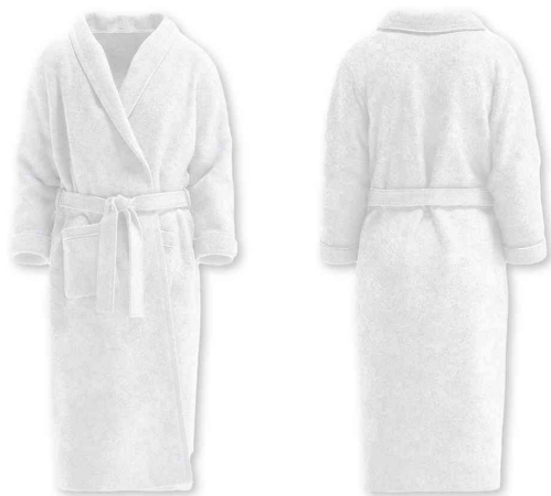
Visuel de référence : montre le produit de face et de dos