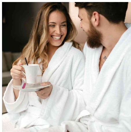
Visuel de référence : montre le produit en utilisation