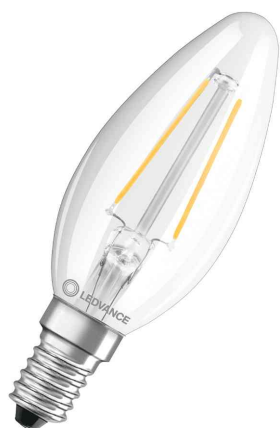
Visuel de référence: Ampoule LED CLASSIC B, culot E14, clair