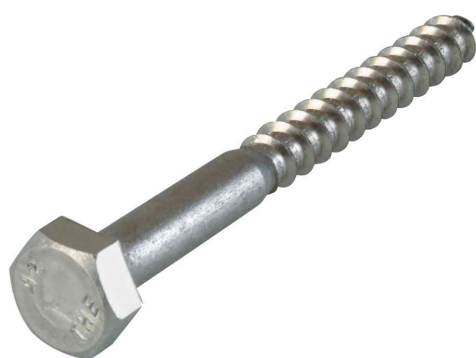
Visuel de référence: tire fond, acier inoxydable