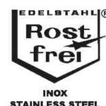
Visuel de référence: tire fond, pictogramme