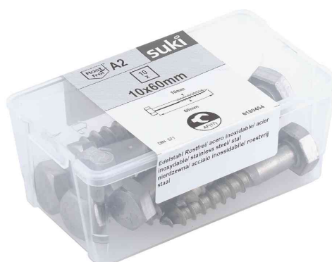
Visuel de référence: tire fond, dans un etui en plastik