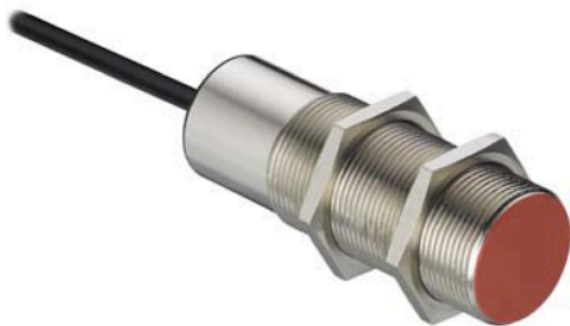
Art.-Nr.: 50136554 LCS-2M30B-F20PNC-K020V Sensor kapazitiv