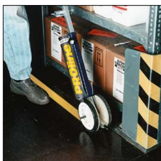
Anwendungsbeispiel als 2-Rad-Gerät.

Markiergerät fahrbar Typ 100, für 2 Dosen Markierfarbe.