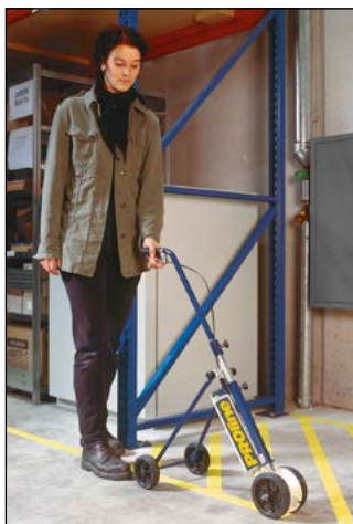
Markiergerät fahrbar Typ 50, für 1 Dose Markierfarbe

Das fahrbare Markiergerät lässt sich schnell und einfach von einem 4-Rad-Markierer (speziell geeignet für die Markierung von langen Linien) in ein 2-Rad-Gerät für die spursichere Markierung dicht entlang von Mauern, Regalen, Maschinen, etc. umbauen. Einfache Einstellung der Strichbreiten durch Verstellmechanik