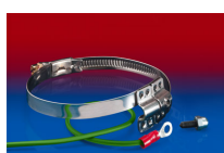
CLAMP 212 EC