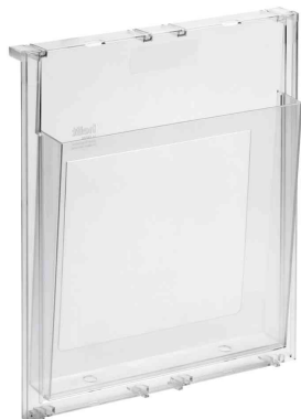
Porte-broschures "the placativ", A4

- présentation de prospectus, images et produits, journaux