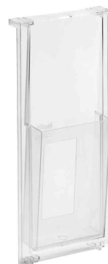
Porte-broschures "the placativ", 1/3 A4