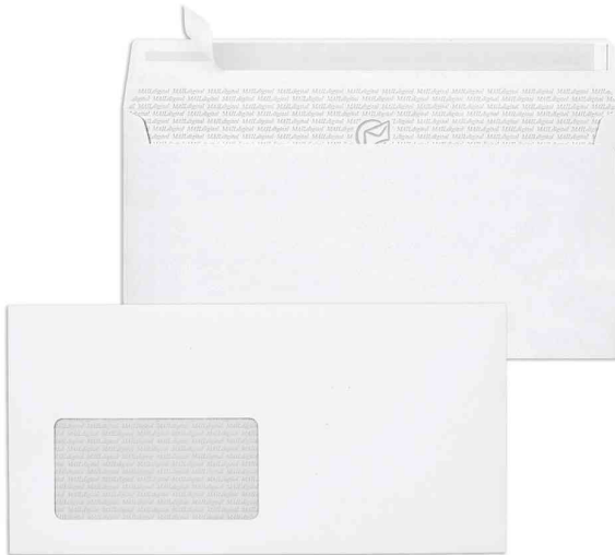
Briefumschlag "MAILdigital", DIN lang

- optimal bedruckbar auf Laserdruckern, Farbkopierern und Inkjetdruckern