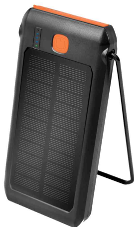
Batterie externe solaire