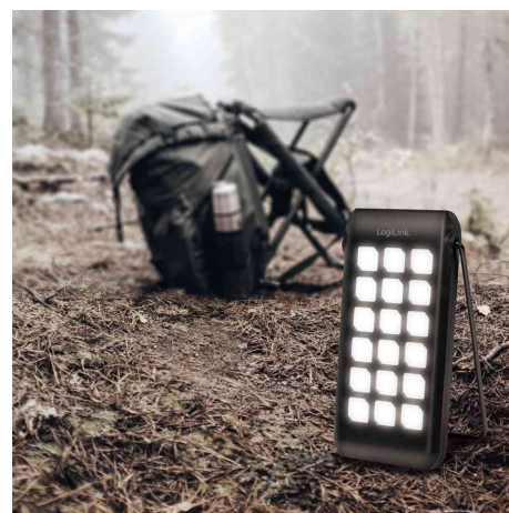
Visuel de référence : présente le produit en utilisation