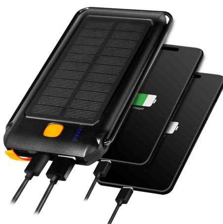
Visuel de référence : présente le produit en utilisation