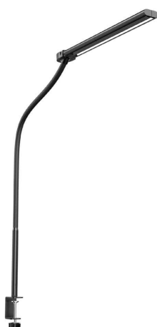
Lampe de bureau à LED ALBATROSS, repliée