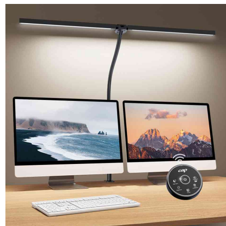
Visuel de référence: montre le produit en utilisation