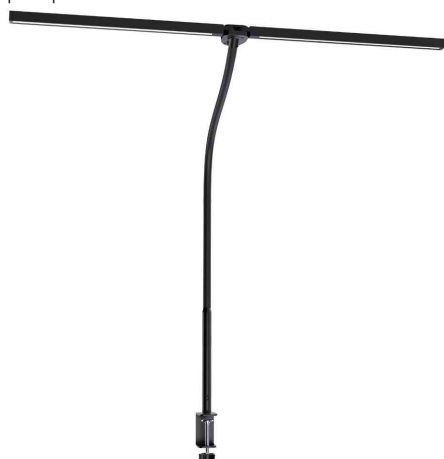
Lampe de bureau à LED ALBATROSS