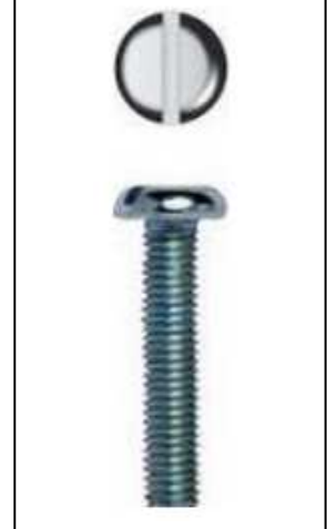
Imagen de producto/ Product picture