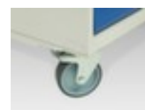
table de travail