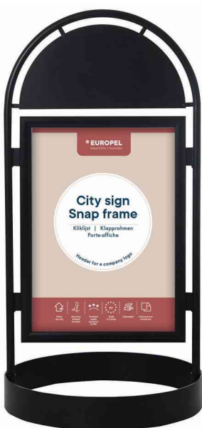
Panneau trottoir CITY SIGN, avec cadre à clipser