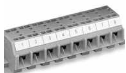
Beschriftung mit selbstklebenden Beschriftungsstreifen