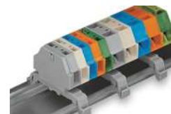
Klemmenleiste; mit Rastfüßen; auf Tragschiene 35