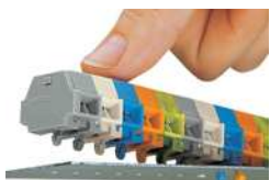
Klemmenleiste mit Rastfüßen; Einrasten in Rastlöcher