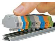
Klemmenleiste mit Rastfüßen; Montage für Aluminiumtragschiene