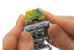
Klemmenleiste mit Rastfüßen Anrasten des Montagefußes (209-120) (Der Abstand der Montagefüße zueinander unter einer Klemmenleiste soll ca. 25 ... 30 mm betragen.)