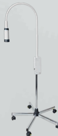
EL10 LED Untersuchungsleuchte mit Rollstativ aus Metall