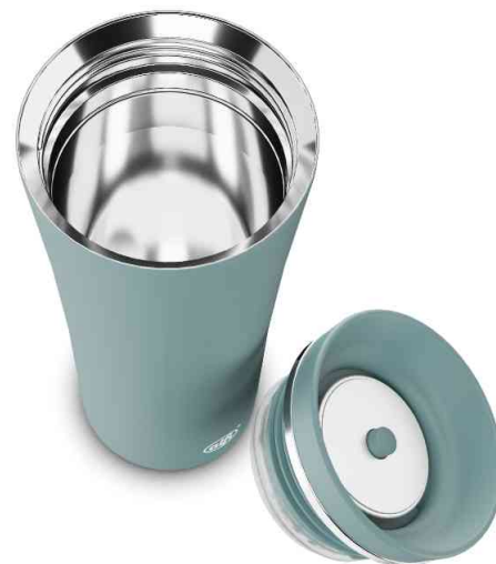
Visuel de référence : présente le produit ouvert