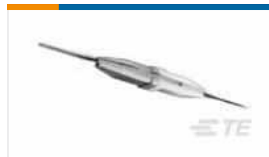
TE Teilnr.:91067-2 INSERTION/EXTRACTION TOOL