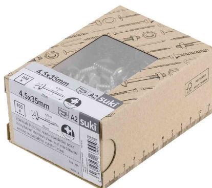
Visuel de référence: vis étanche, dans un carton