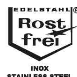
Visuel de référence: vis étanche, pictogramme