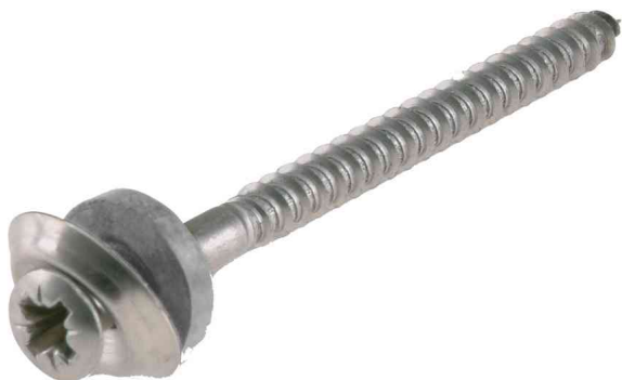
Visuel de référence: vis étanche