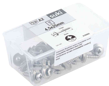
Visuel de référence: vis étanche, dans une boîte en plastique