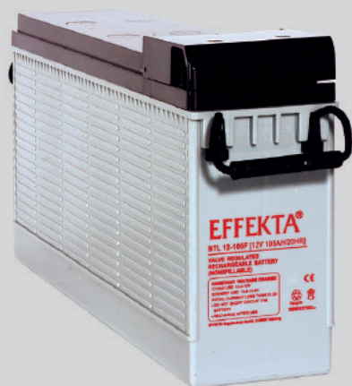
BTL12-105F (rechtes Bild: Anschlußterminals)