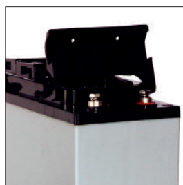
BTL12-55F (linkes Bild: Anschlußterminals)

Die BTL-Frontterminal Batterien von EFFEKTA® sind elektrisch baugleich zu den herkömmlichen BTL-Typen, werden jedoch insbesondere bei besonderen Anforderungen an den Einbau oder die Anschlüsse verwendet. Die Bauform ist für den Einsatz in 19"- Schränken optimiert.