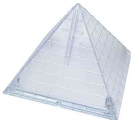
Conteneur à lames Pyramide iCD-400P