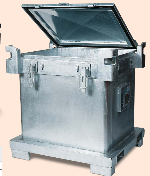
ASP-Behälter 800 Liter