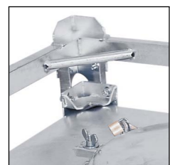
Alle ASF-Behälter sind stapelfähig, sodass eine kompakte, Platz sparende Lagerung möglich ist.