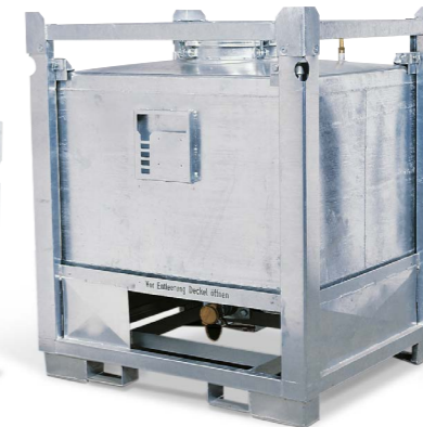
Behälter Typ ASF-B mit Bodenauslauf, 800 Liter