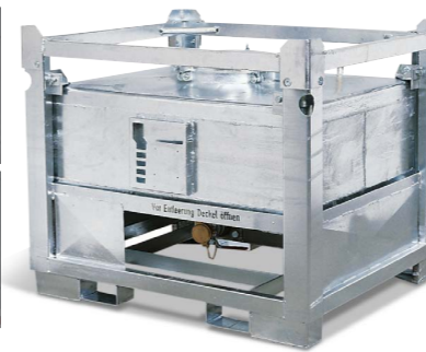
Behälter Typ ASF-B mit Bodenauslauf, 445 Liter