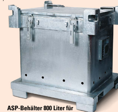
ASP-Behälter 800 Liter für leere Spraydosen

für 600 und 800 Liter Bestell-Nr 117-966-J9