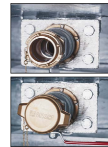
Detailabbildungen: Absperrarmatur mit 2"-Kugelhahn