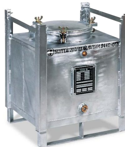
Behälter Typ ASF-D, 100 Liter, doppelwandig