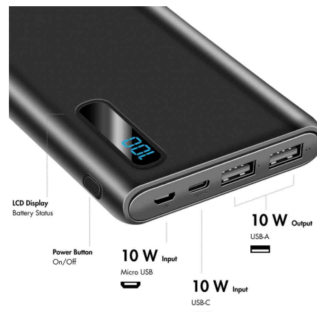
Visuel de référence: montre les ports