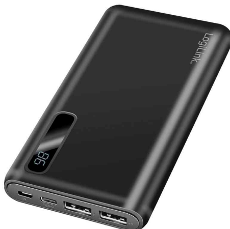
Batterie externe mobile avec écran, noir