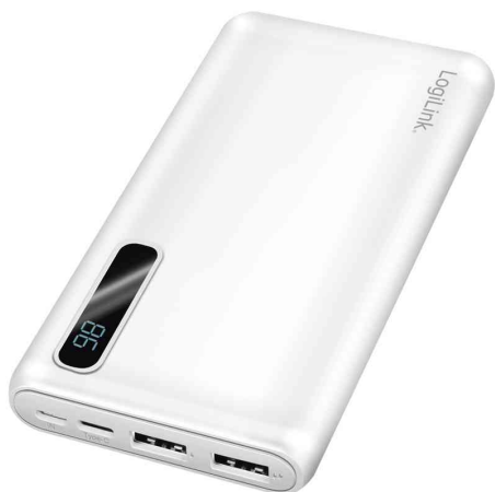
Batterie externe mobile avec écran, blanc