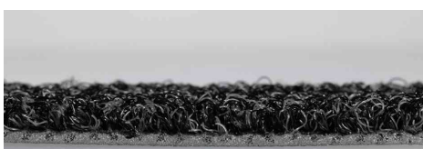
Visuel de référence : montre le produit en détail