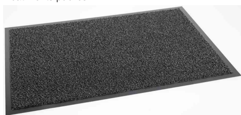
Tapis anti-salissures EAZYCARE CURL