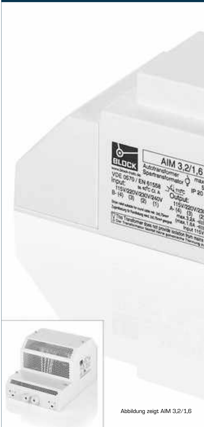
Abbildung zeigt AIM 3,2/1,6