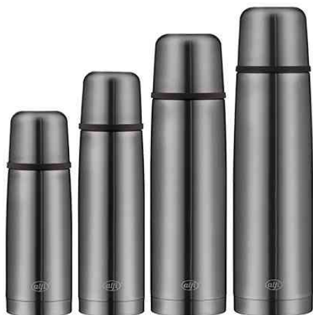
Visuel de référence : bouteille isotherme ISOTHERM PERFECT