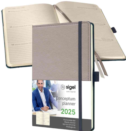
Agenda planning Conceptum Design Casual, beige