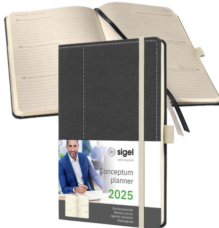
Agenda planning Conceptum Design Casual, gris / blanc