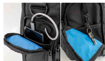
Visuel de référence : montre les poches latérales