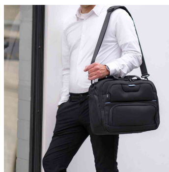
Visuel de référence : montre le sac porté en bandoulière