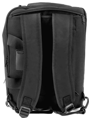
Sac multifonction 3 en 1 RPET NIAS