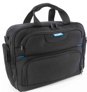
Sac multifonction 3 en 1 RPET NIAS