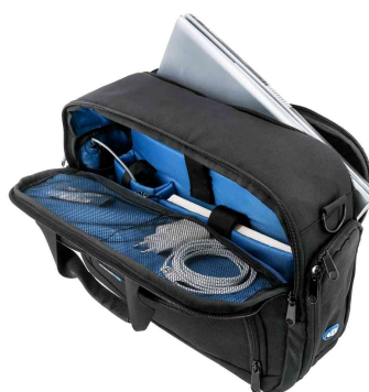
Sac multifonction 3 en 1 RPET NIAS, ouvert