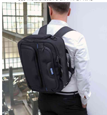
Visuel de référence : montre le produit utilisé comme sac à dos