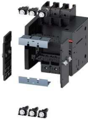
Einschubeinheit Komplettbausatz Zubehör für: Leistungsschalter, 3-polig 3VA12