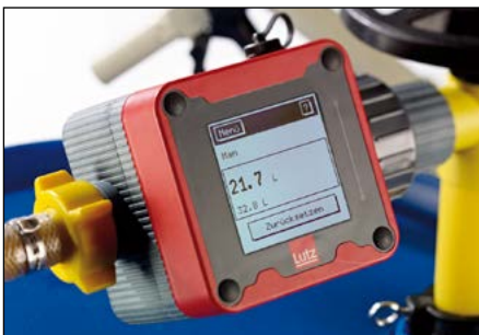
Durchflusszähler für Fass- und Containerpumpen.