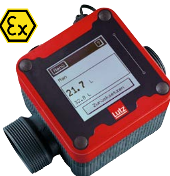
Durchflusszähler für Ex-Fasspumpen und Ex-Containerpumpe CM