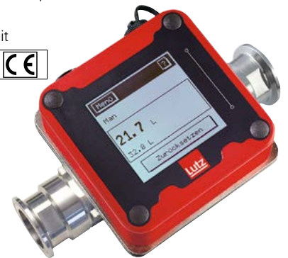
Durchflusszähler für Lebensmittelpumpen

Mehrpri Relaismodul für Mengenvorwahl, nicht Ex-geschützte Version, Bestell-Nr. 121-590-J0