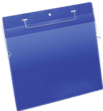
Pochette avec support en fil de fer, A4 paysage