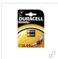
Duracell N (MN 9100) BG2