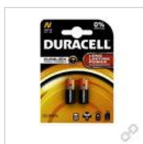
Duracell N (MN 9100) BG2