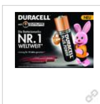
Anzeigenvorlage Duracell 'Die Batteriemarke Nr. 1 Weltweit'