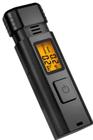
Éthylotest avec écran LCD