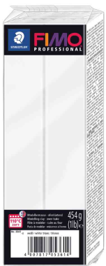
Pâte à modeler PROFESSIONAL, blanc