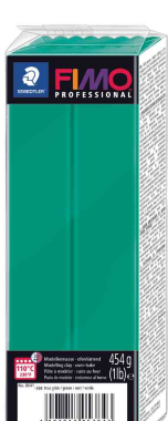
Pâte à modeler PROFESSIONAL, vert pur