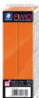
Pâte à modeler PROFESSIONAL, orange