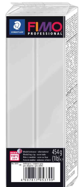
Pâte à modeler PROFESSIONAL, gris dauphin