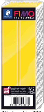
Pâte à modeler PROFESSIONAL, jaune pur