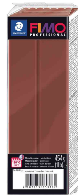
Pâte à modeler PROFESSIONAL, chocolat