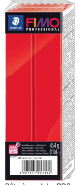
Pâte à modeler PROFESSIONAL, rouge pur