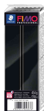
Pâte à modeler PROFESSIONAL, noir