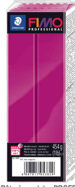
Pâte à modeler PROFESSIONAL, magenta pur