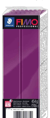
Pâte à modeler PROFESSIONAL, violet