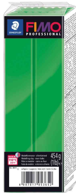
Pâte à modeler PROFESSIONAL, vert prairie