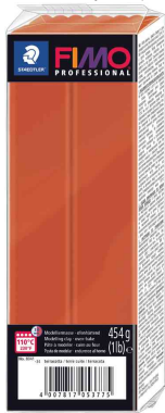
Pâte à modeler PROFESSIONAL, terre cuite