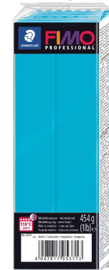
Pâte à modeler PROFESSIONAL, turquoise