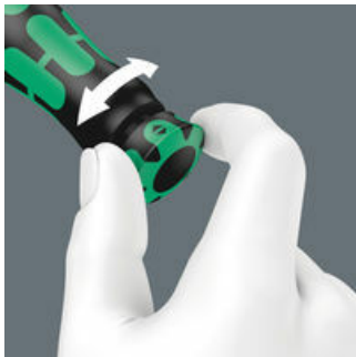
Mit hör- und fühlbarem Einrasten bei Erreichen der Skalenwerte.