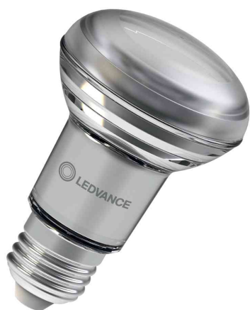
Visuel de référence: Ampoule à réflecteur LED R63 DIM, culot E27

Exemples d'utilisation: - utilisation dans le domaine privé et professionnel - vitrines et panneaux d'affichage - éclairage spot d'objets sensibles à la chaleur tels que les aliments, plantes etc. - utilisations à l'extérieur uniquement dans des luminaires adaptés