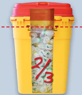
Füll-Linie beachtet siehe Markierung