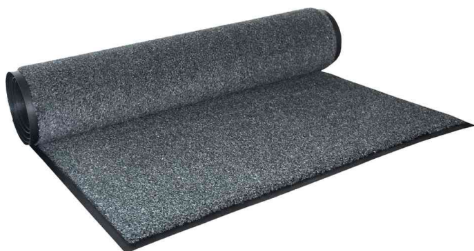
Tapis anti-salissure Olefin