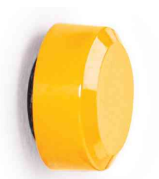
Vue détaillée: profil