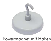
Powermagnet mit Haken